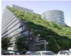
Estrategias de ahorro Energético

ASERORIA PARA LA GESTION DEL CENTRO DE DATOS Y MEJORES PRACTICAS DE EFICIENCIA ENERGETICA Como densidad dentro del centro de cómputo o comunicaciones. En tiempos actuales, debemos buscar la mejor forma de enfriar los servidores dentro de los espacios de los centros, y buscar hacer eficiente el uso de la energía en los centros de cómputo o de comunicaciones, basado en la Guía de Buenas prácticas desarrollada por el Cime